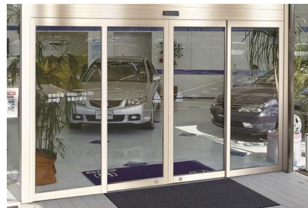
オートドア スタンダード 単板 15・65・80框