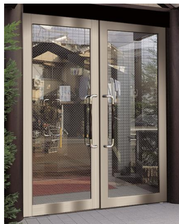
フロアヒンジドア 単板 65・80框