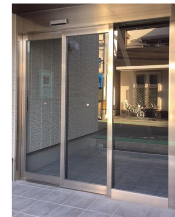
オートドア ダブルスライド 単板 15・65・80框