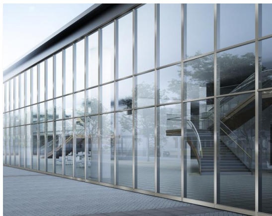
FIX窓 スリム外倒し窓 単板 複層 100・160方立